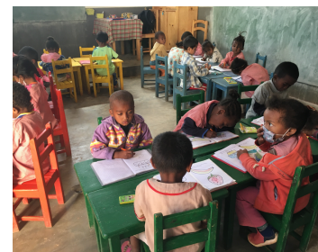
Classe de préscolaire (maternelle) dans le secteur d'Antsirabe

Pour cette première rentrée scolaire en septembre dernier, et en partenariat avec 14 écoles d'Antsirabe, nous avons formé et ac-