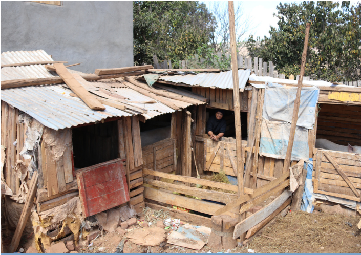
Une emprunteuse de VAHATRA pratiquant la porciculture (Antsirabe)