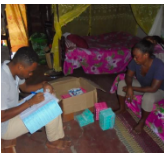
Etude d'une nouvelle demande de prêt au domicile de la micro-emprunteuse