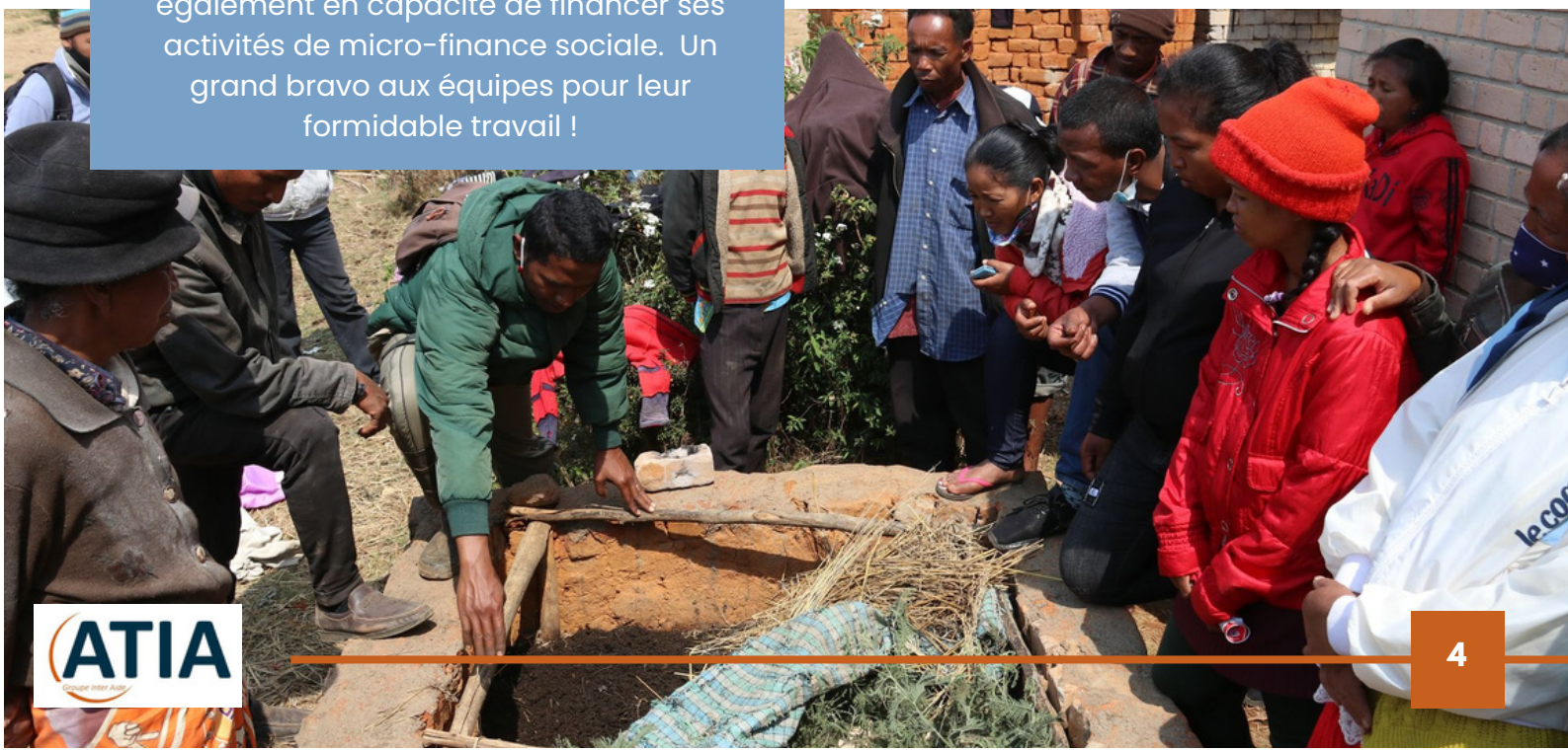
Démonstration de la fabrication de lombricompost à des partenaires d’Ambatolampy

Nous avons aussi continué à travailler à l’autonomisation des activités mises en place, avec par exemple la montée en compétence d’un de nos techniciens agricoles pour me remplacer. C’est aussi la dernière année de ma présence sur le terrain et de l’appui technique et financier d’ATIA à VAHATRA. Un très beau partenariat qui se termine sur un avenir plein de promesses pour VAHATRA. ”