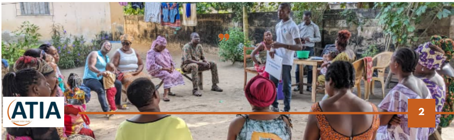
Réunion d'information sur les services de la mutuelle de santé à Adidagomé (Oct. 2023) :

Fin 2023, on compte plus de 700 familles couvertes par la mutuelle. Ces chiffres vont continuer à croître en 2024, ce qui améliorera l'accès aux soins pour davantage de familles, et in fine , sécurisera leur situation socio-économique.”