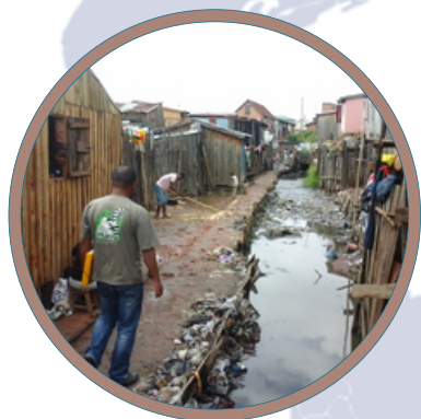
Exemple de zone d'intervention : ici, dans les bas quartiers de Tana (Madagascar)