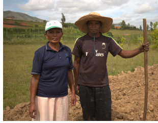
Un couple de paysans-relais de VAHATRA (région Itasy)