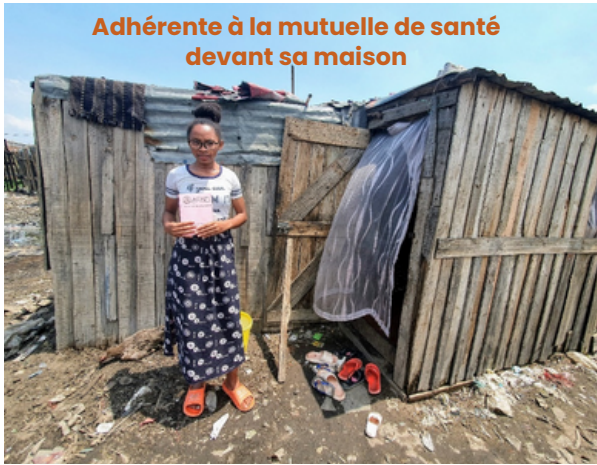
Adhérente à la mutuelle de santé devant sa maison

Avec AFAFI, elles pourront désormais bénéficier d'une prise en charge des soins et accoucher à l'hôpital.