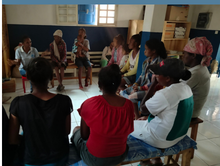
Groupe de parole entre femmes

Depuis mi-2023, KOLOAINA prend en charge l’animation et la coordination des activités au sein du centre, en plus de ses missions sociales habituelles.