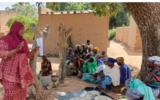
Ci-contre : sensibilisation à la santé préventive sur la dengue par une animatrice de TOND LAAFI (Nov. 2023).

Pour l'année à venir, TOND LAAFI a encore de nombreux défis à relever tels que la digitalisation du service médico social, la mise en place d'une permanence mobile pour des consultations médicales de qualité dans les zones périphériques de Ouagadougou et la sensibilisation des hommes à un meilleur recours aux soins à travers une méthode de «pères témoins».”