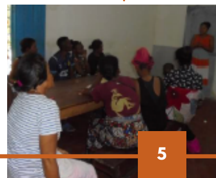
Formation des nouveaux emprunteurs

En 2024, nous allons mettre en place un produit de prêt lié à l'agriculture et poursuivre le développement avec la création d'une nouvelle agence.”