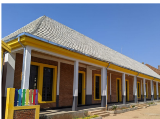
Classes primaires rénovées dans le centre ville d'Antsirabe en partenariat avec la Fondation Axian

Nous sommes impatients de mesurer l'impact de ce projet sur la vie éducative de la région. D'ores et déjà, 11 nouvelles écoles se sont engagées dans le projet pour l'année scolaire prochaine (2024-2025).”